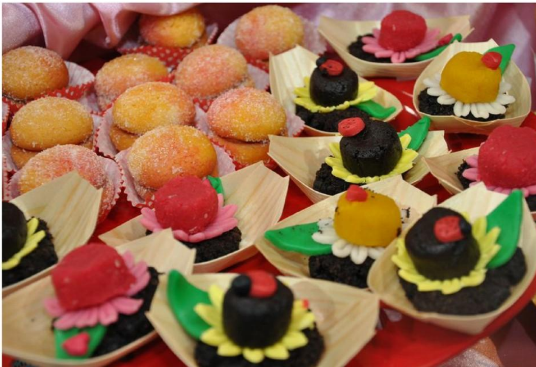
Med raznovrstnimi sladkimi izdelki boste našli tudi veganske sladice, sladice brez glutena in celo pasje priboljške.

Jubilejna 10. Sladka Istra bo trajala kar tri dni, in sicer od petka, 28. do nedelje, 30. septembra, od 9. do 19. ure. Na poglavitnih mestnih trgih in drugih prizoriščih (Titov trg, Prešernov trg, Carpacciov trg, Gortanov trg, Taverna...) po Kopru bo več kot 140 stojnic, na katerih boste lahko v zameno za degustacijske kupone okušali istrske sladice , tradicionalne slovenske in tuje sladice, raznorazne čokoladne izdelke, sladke izdelke s slovenskih kmetij, pa tudi vina in druge sladke pijače.