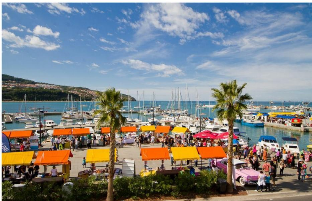
10. Sladka Istra Koper

Zadnji vikend septembra bo Koper prizorišče 10. Sladke Istre - največjega mednarodnega festiva sladic in sladkih izdelkov v Sloveniji.